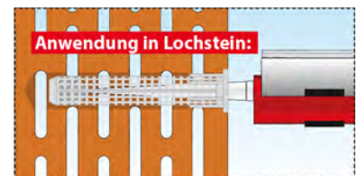
Liquix Blaster Pro